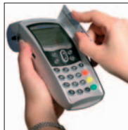
Carte à piste